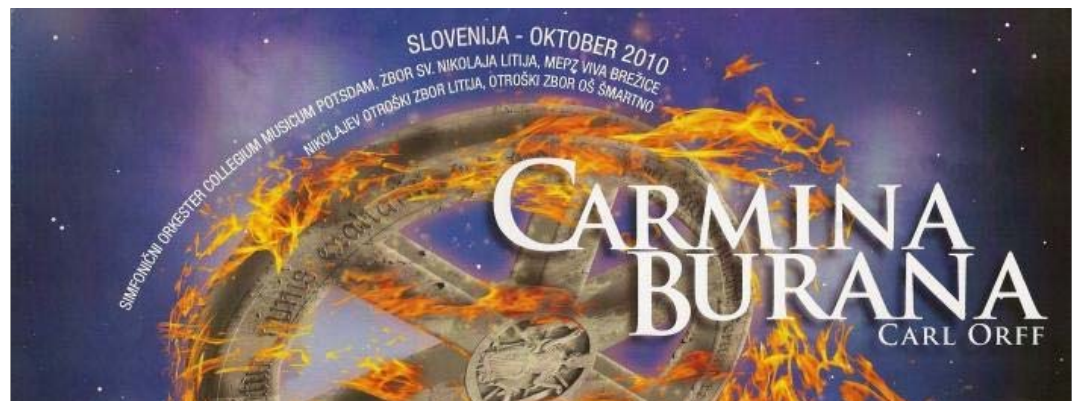
Naslovnica koncertne knjižice

Obvestilo o Copyright-u: ni Gimnazije Litija je bil v soboto, 2. oktobra 2010, ob 20. uri koncert, posvečen 20. obletnici zružitve Republike Nemčije in spominu na dirigenta Carlosa Kleiberja, ki je pokopan v Konjščici pri Litiji. Na sporedu je bila Orffova CARMINA BURANA za soliste, zборе in veliki simfonični orkester, ob začetku pa so izvajalci izvedli še Evropsko himno (zaključni stavek Beethovnovne 9. simfonije) v nemščini in slovenščini.